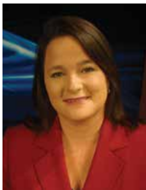
By Suzanne Potter www.newsservice.org